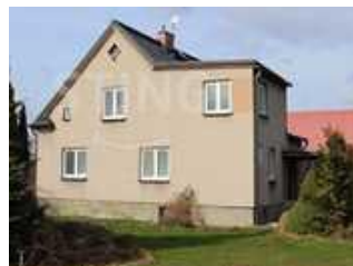
Zdroj: Vklad V-1324/2025-832 z 14.4. 2025

K1 Redukce pramene ceny - V-1324/2025-832 z 14.4. 2025 1,00 K2 Velikosti objektu - menší užitná plocha, 2 BJ 0,96 K3 Poloha - obdobná obec, m.č. Třince 1,00 K4 Provedení a vybavení - vytápění - ÚT, radiátory, plyn, TP 0,98 K5 Celkový stav - k rekonstrukci, 2.NP po částečné reko, vyměněna krytina 0,95 K6 Vliv pozemku - pozemek 2273 m 2 0,90