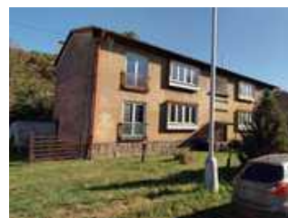
Zdroj: Vklad V-2779/2025-832 z 1.8. 2025

K1 Redukce pramene ceny - V-2779/2025-832 z 1.8. 2025 1,00 K2 Velikosti objektu - větší užitná plocha, 3 BJ - stejné, vlastní vstupy 0,85 K3 Poloha - obdobná obec, m.č. Třince 0,99 K4 Provedení a vybavení - vytápění - ÚT, radiátory, plyn, samostatné měřiče 0,97 K5 Celkový stav - k rekonstrukci 1,00 K6 Vliv pozemku - pozemek 870 m 2 1,00