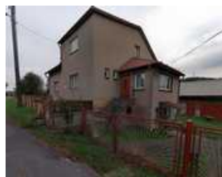
Zdroj: Vklad V-4275/2025-832 z 11.12.2025